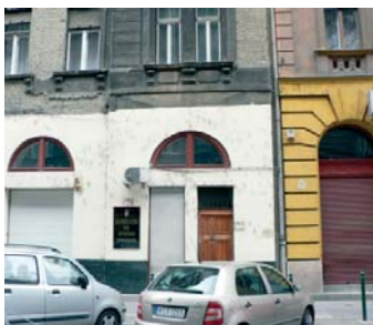
1073 Budapest, Kertész u. 35.