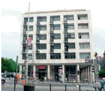
1024 Budapest, Margit krt. 43–45. IV em. 6.