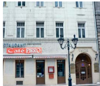
1051 Budapest, Hercegrímás u. 18. Fsz.t.