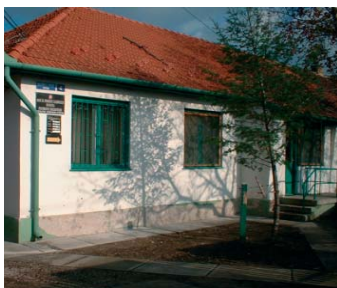
2700 Cegléd, Dugonics u. 4.