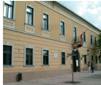
2600 Vác, Köztársaság út 19.