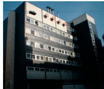
1132 Budapest, Kresz Géza u. 15.