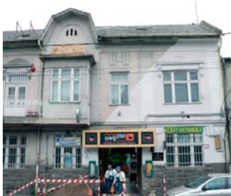
1181 Budapest, Üllői út 453.