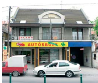
1221 Budapest, Kossuth L. u. 34.