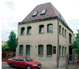
1041 Budapest, Deák F. u. 28.