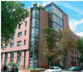
1096 Budapest, Vaskapu u. 33–35.