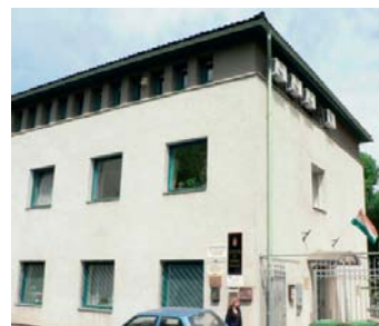
1173 Budapest, Egészségház u. 3.