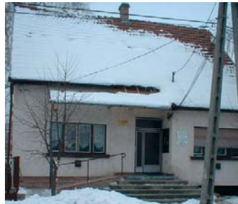
2370 Dabas, Szent István út 79.