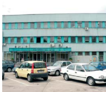
1033 Budapest, Kaszásdűlő u. 2.