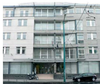
1148 Budapest, Fogarasi út 3.