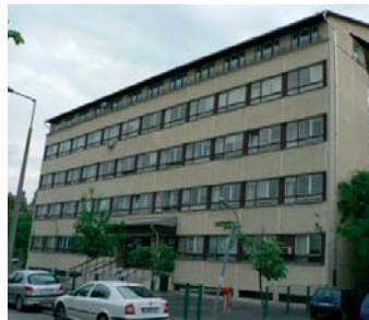
1139 Budapest, Petneházy u. 6–8.