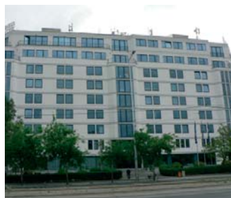
1146 Budapest, Hungária krt. 179 187. I. em.