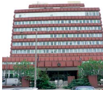
1144 Budapest, Gvadányi u. 69.