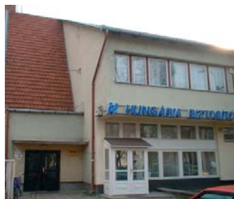
2760 Nagykáta, Szabadség tér 16.