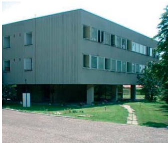
2300 Ráckeve, Kossuth L. u. 96.