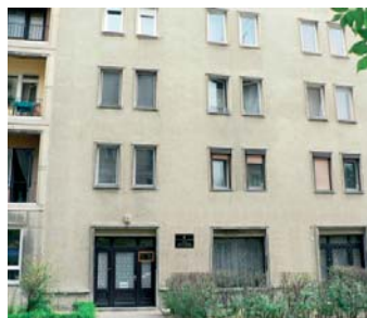
1113 Budapest, Hamzsabégi út 18.