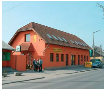
2310 Szigetszentmiklós, Gyári u. 9.