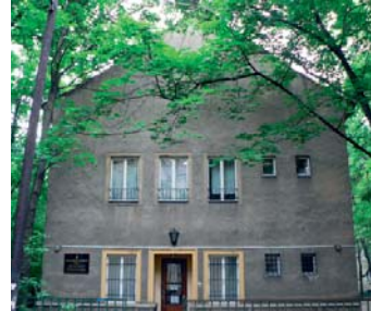
1155 Budapest, Örkjárt u. 4/b