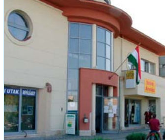
2030 Érd, Budai u. 24.